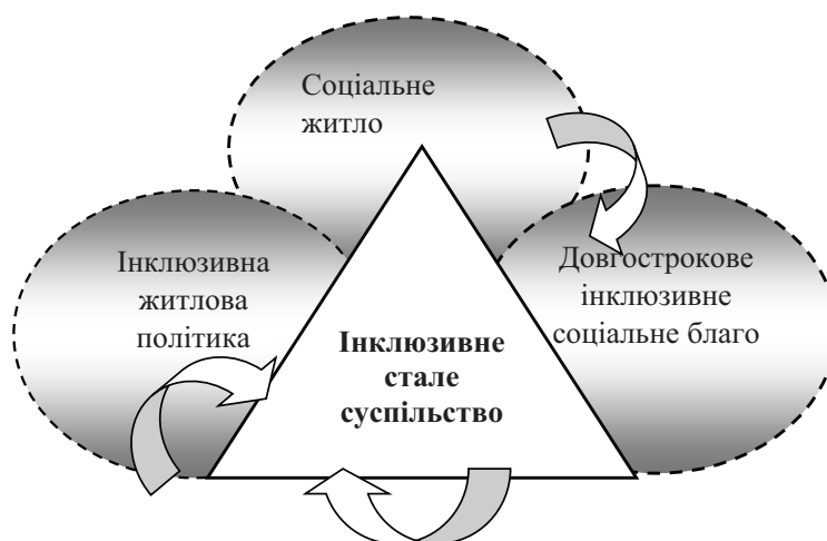
Рис. 3. Місце і роль соціального житла у формуванні інклюзивної житлової політики